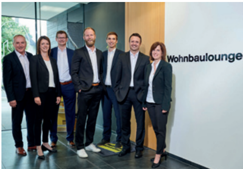
Team der Wohnbaulounge der Raiffeisenbank am Hofsteig

Förderung für seinen Wohnraum bekommt, wissen die Experten der Raiffeisenbank am Hofsteig. Dazu kommt das große Netzwerk, das die Kunde nutzen können: vom Notar und Steuerberater bis hin zum Bauträger und dem Vorarlberger Energieinstitut. Weil die Raiffeisenbank am Hofsteig ein Begleiter für alle Lebensabschnitte ist, runden das richtige Konto, das praktische Online Banking, die aussichtsreiche Geldanlage und alle weiteren, passenden Finanzlösungen das Paket ab. Eben alles aus einer Hand in Wolfurt.